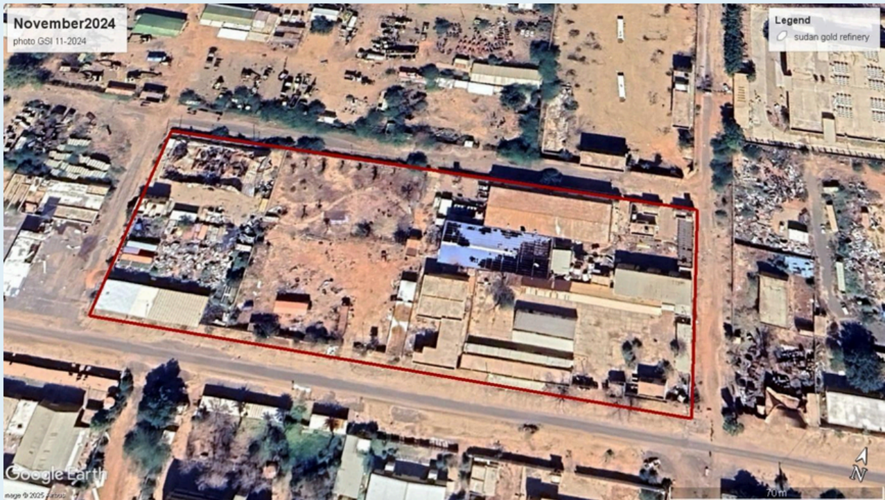
Sudan Gold Refinery, November 2024.