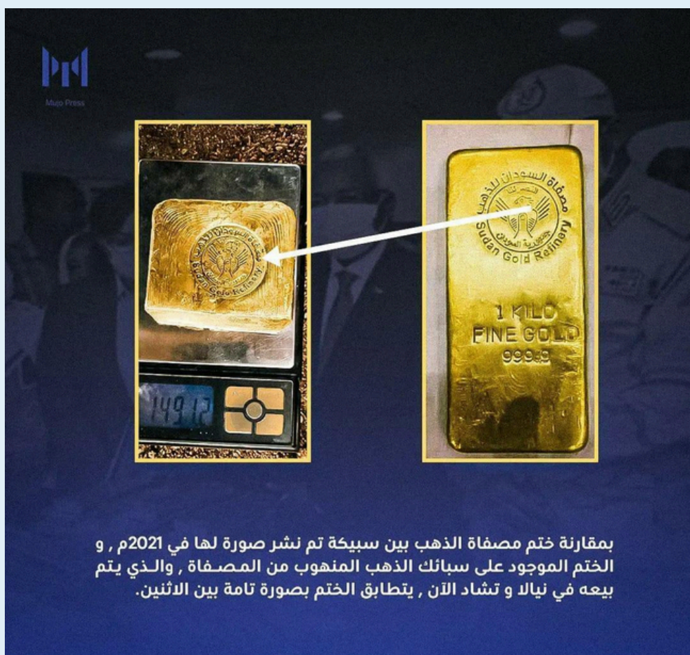
بمقارنة ختم مصفاة الذهب بين سبيكة تم نشر صورة لها في 2021م , و الختم الموجود على سبائك الذهب المنهوب من المصفاة , والذي يتم بيعه في نيالا و تشاد الآن , يتطابق الختم بصورة تامة بين الاثنين.