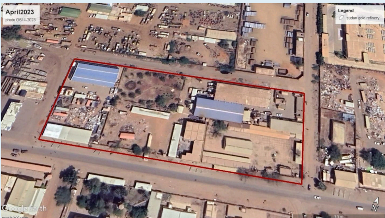
Sudan Gold Refinery, April 2023