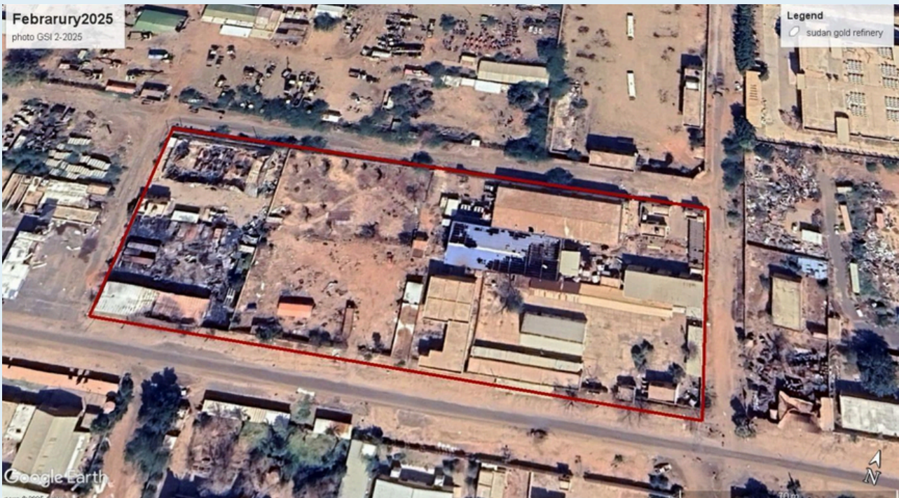
Sudan Gold Refinery, Februar 2025.